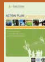
Foto de portada: © FAO/Olivier Asselin; página 2: © FAO/Issouf Sanogo; página 4: ©/FAO/Ishara Kodikara; página 5: © FAO/Giulio Napolitano; página 6: © FAO/Mary Jane Dela Cruz